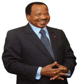
S.E.M Paul BIYA Président de la République Chef des Forces Armées