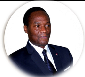
M. Joseph BETI ASSOMO Ministre Délégué à la Présidence, Chargé de la Défense